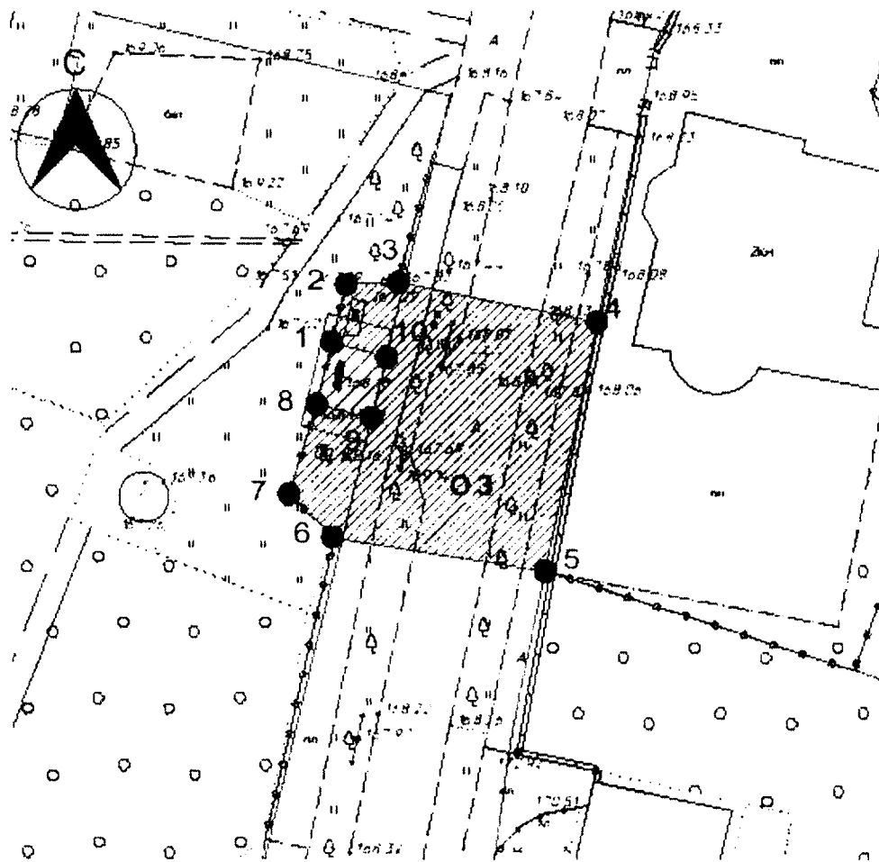
Схема зон охраны объекта культурного наследия местного (муниципального) значения «Памятник рабочим фабрики, погибшим в годы Великой Отечественной войны», 1941-1945 гг. (Брянская область, Клинцовский район, город Клинцы, улица Ворошилова (территория Ленинского парка) М 1:500